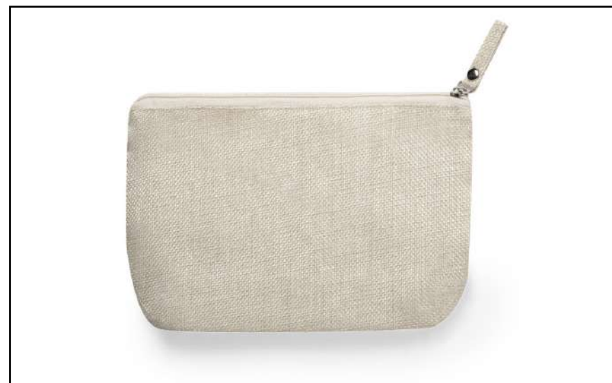
NECESER SUBLIMACIÓN KRIA 6433

Mochila de cuerdas de suave poliéster 210T en extensa gama de colores.