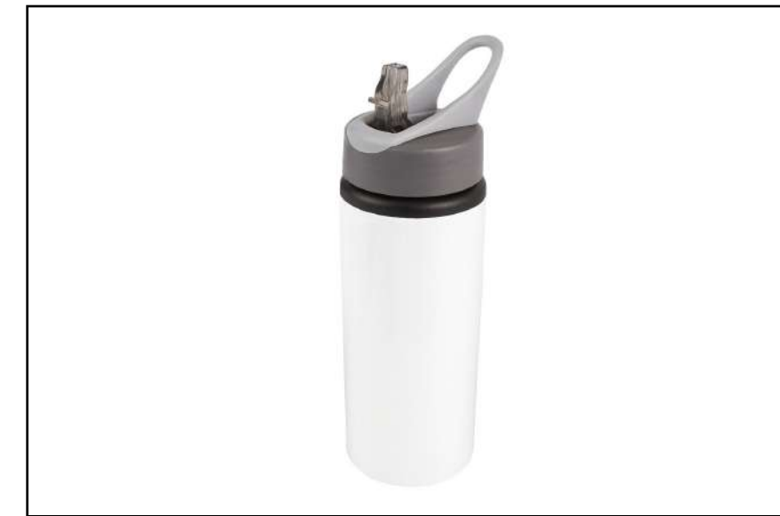
TERMO SUBLIMACIÓN PIORX 6409

Especialmente elaborado para impresión en sublimación.