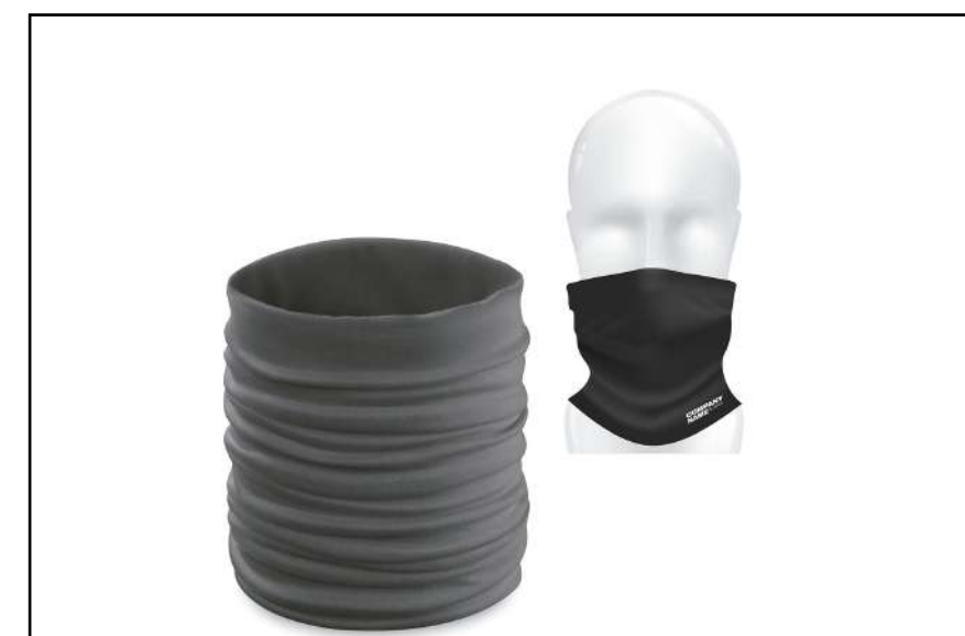
BRAGA SPORT 4215

Bolsa plegable en divertidos y variados colores. De suave poliéster 190T, con elástico para plegado y de acabado cosido.