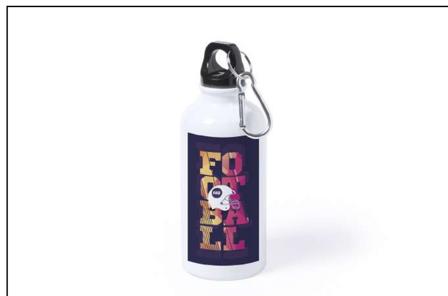
CILINDRO SUBLIMACIÓN ACACIA 5341

Especialmente diseñada para marcaje en sublimación.