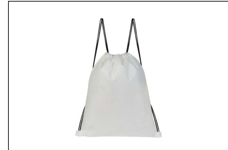
MOCHILA OSPK 3164

Alfombrilla de diseño circular en suave poliéster de vivos colores y con base antideslizante en silicona.