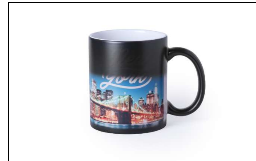
TAZA SUBLIMACIÓN ARGUS 5837

Con tapón de seguridad a rosca en acero inox y cinta de transporte.