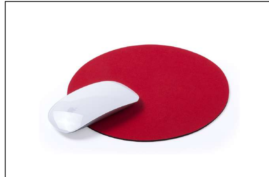
ALFOMBRILLA ROZZ 5520

Alfombrilla de diseño circular en suave poliéster de vivos colores y con base antideslizante en silicona.