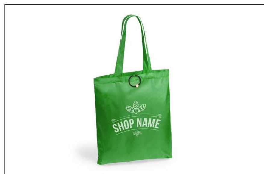
BOLSA PLEGABLE CELER 4781

Taza metálica de diseño retro con 380ml de capacidad. Especialmente diseñada para marcaje en sublimación, con elegante detalle en color negro y presentada en caja individual.