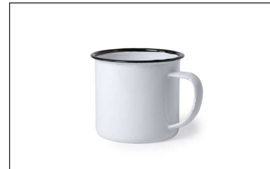
TAZA SUBLIMACIÓN KATU 6359

Neceser de inspiración nature, en resistente poliéster de suave tacto, especialmente elaborado para impresión en sublimación.