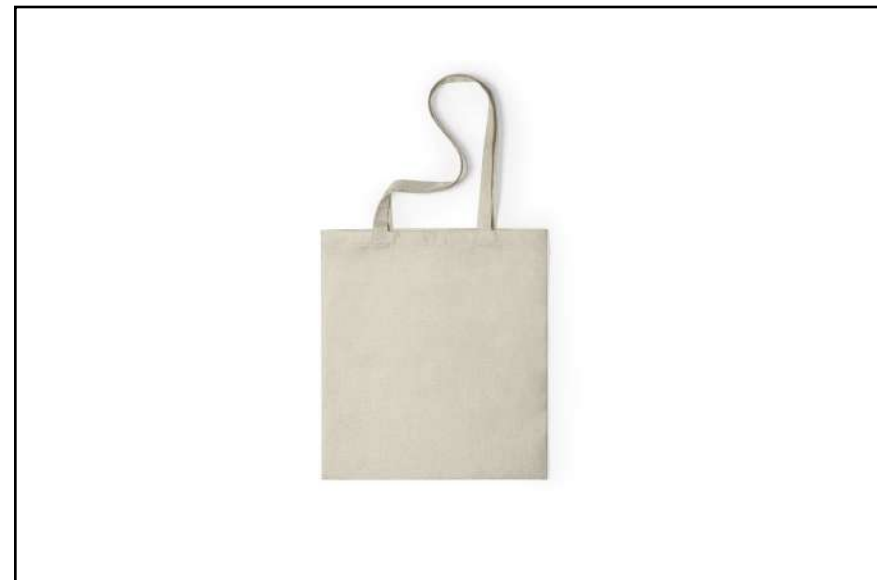
BOLSA SUBLIMACIÓN MUSO 6431

Bolsa de inspiración nature, en resistente poliéster de suave tacto.