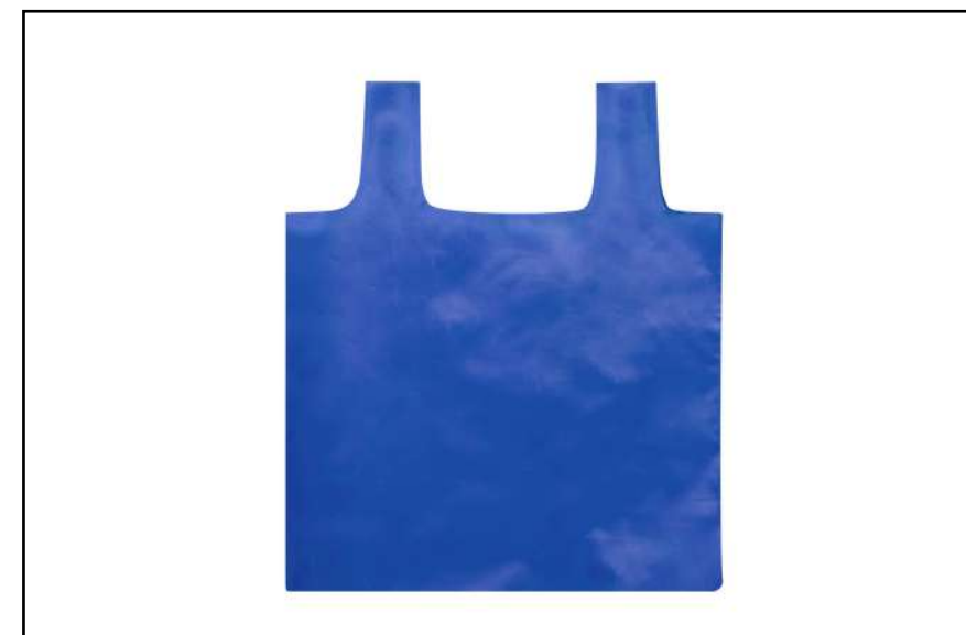
BOLSA PLEGABLE RETURN

Accesorios en color gris, con acolchado en espalda y cintas de hombros.