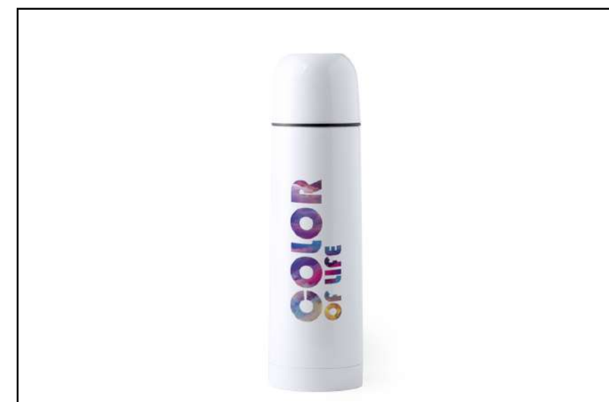
TERMO SUBLIMACIÓN ADEMIA 6165

Bidón de 400ml de capacidad con cuerpo de acabado en suave y brillante color blanco, especialmente diseñado para marcaje en sublimación.