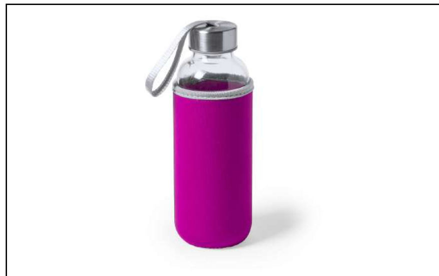
CILINDRO BASTINA 5513

Termo en acero de 330ml. Con doble cobertura para mejor y mas duradera conservación de la temperatura y sistema de apertura fácil con botón.