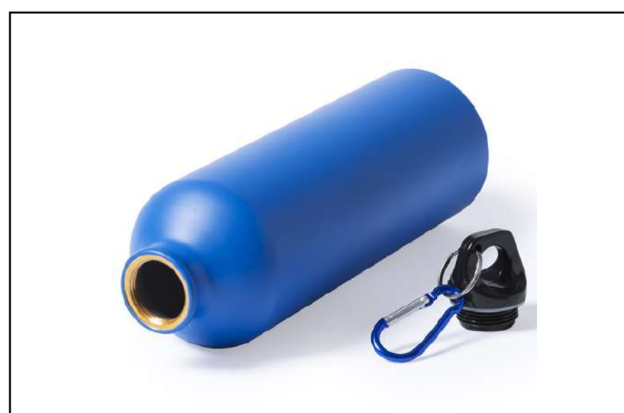
CILINDRO AURE 5491

Cilindro de cristal de 420ml de capacidad con funda de neopreno en vivos colores. Con tapón de seguridad a rosca y cinta de transporte.