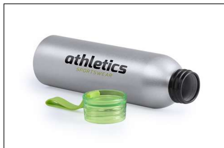
CILINDRO ALUMINIO VIBRA 5986

Cilindro de aluminio de 650 ml de capacidad. Cuerpo en color plateado, con tapón de seguridad a rosca en variada gama de colores transparentes.