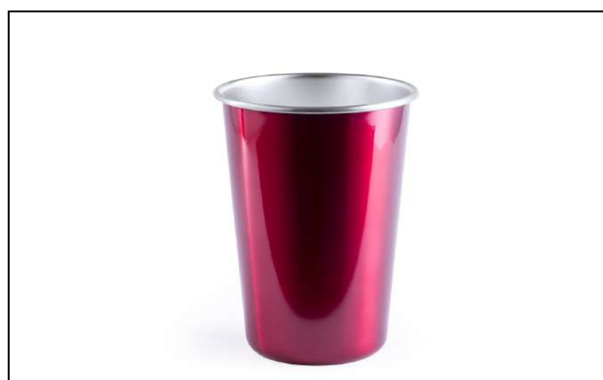
VASO INOXIDABLE AQUA 5978

Cilindro en alta calidad y de gran capacidad de 580 ml, con cuerpo en variada gama de colores translúcidos, tapón de seguridad a rosca en acero inox y resistente asa de transporte.