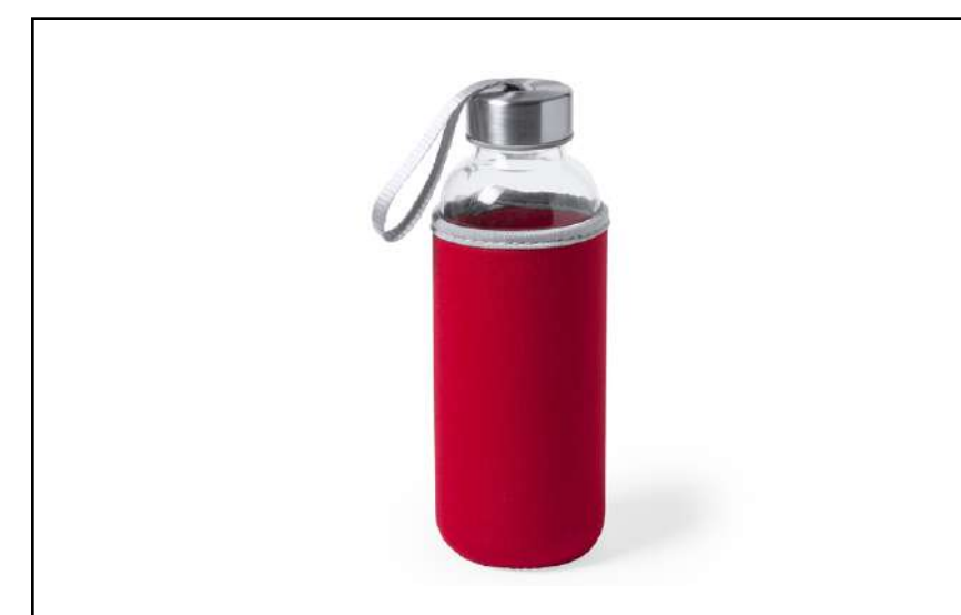
CILINDRO BASTINA 5513

Original vaso en acero inoxidable de 500ml de capacidad. Con parte exterior en colores metalizados de alto brillo e interior en cromado semi mate.