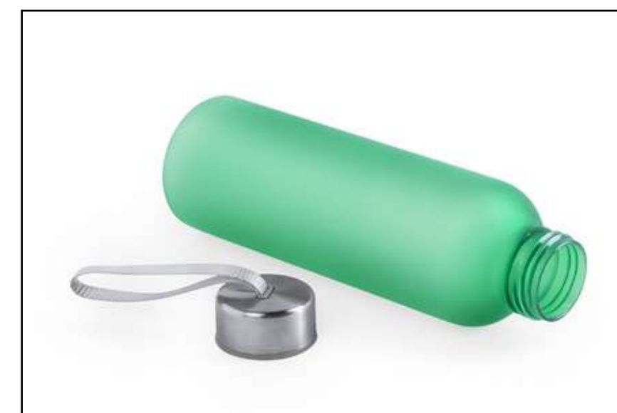
CILINDRO TRANSPARENTE INV 5931

Cilindro de aluminio de 650 ml de capacidad. Cuerpo en color plateado, con tapón de seguridad a rosca en variada gama de colores transparentes.