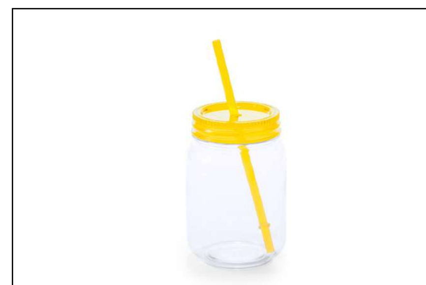
TARRO ATTIS 4820

Cilindro/Termo de 800ml de capacidad con cuerpo de acabado en aluminio en vivos y variados colores.